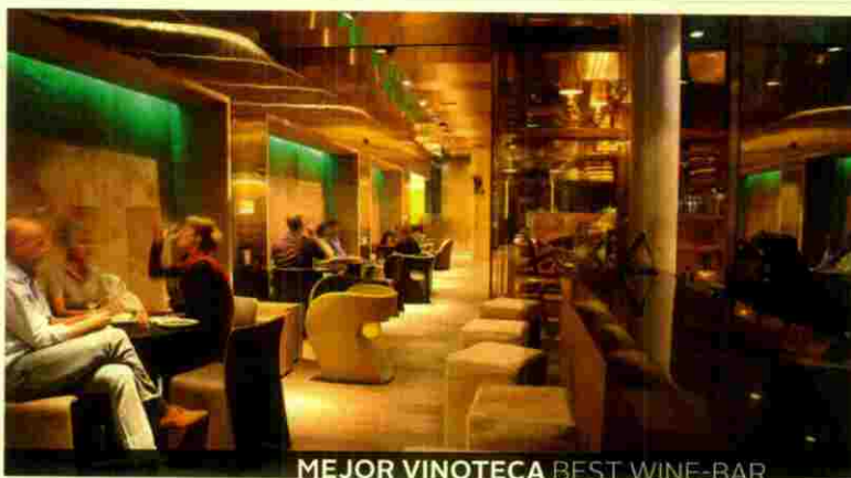
MEJOR VINOTECA BEST WINE-BAR